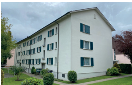
Liegenschaft Greifenseestrasse 15 auf dem Plan Rot eingezeichnet

Nach dem Kauf des Grundstücks an der Greifenseestrasse 11 hat die GISA Ende letzten Jahres das direkt angrenzende Grundstück an der Greifenseestrasse 15 gekauft. Damit ergänzen nun beide aneinandergebaute Liegenschaften mit insgesamt 12 Wohnungen unsere Siedlung in Oerlikon.