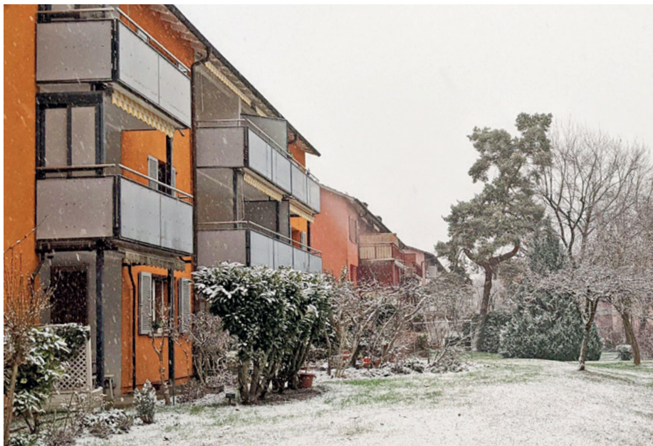
Winterstimmung am Kirchenackerweg/Greifenseestrasse in Oerlikon.